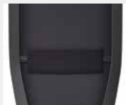
Lumbalstütze höhenverstellbar (6 cm), gepolstert Lumbar support height-adjustable (6 cm), upholstered