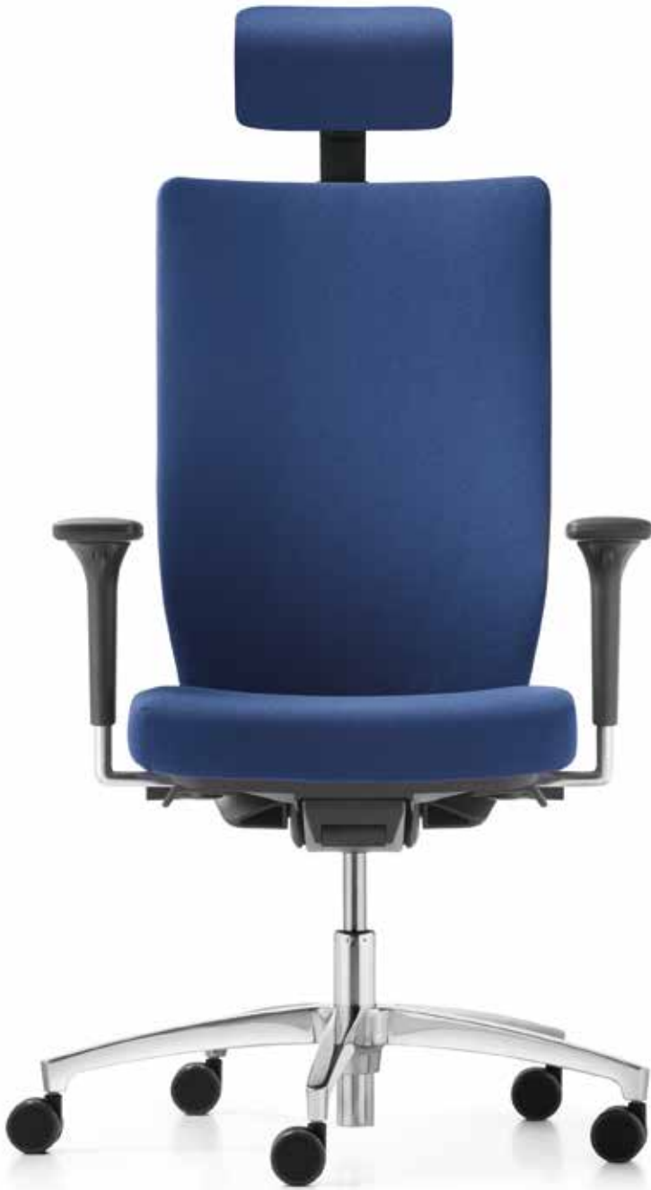
TA ST 6884 mesh comfort + Armlehnen | Armrests A341APO