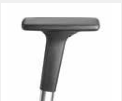
A341APO / A441APO (3F/4F) Armauflagen PU soft Armpads PU soft