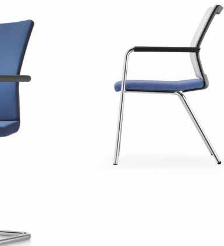
ST 6800 mesh Armauflagen | Armpads AA03KGS

The Stilo series will cut a good figure in any room. A choice of two cantilever frames is available: non-stackable or a stackable version up to 9-high. The four-legged models are stackable up to 4-high and even more mobile on castors. And the conference swivel chairs – also available as a counter version – offer a relaxed seating comfort thanks to their Conference-Relax mechanism. Either in terms of colour, shape or function – the Stilo line-up is a perfect team.