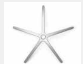
FHAPO Aluminium poliert (Option) Aluminium polished (option)