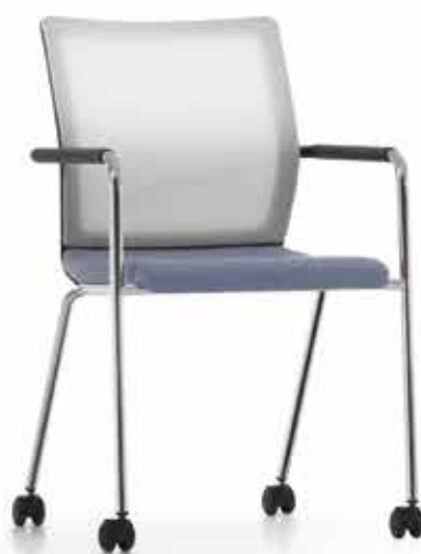
ST 6802 mesh Armauflagen | Armpads AA03KGS