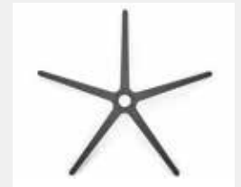
FHKGS Kunststoff schwarz (Standard) Black plastic (standard)