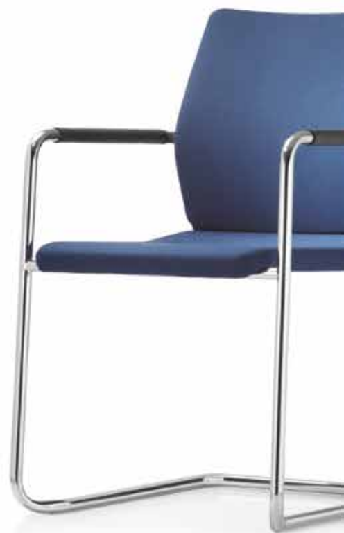
ST 6835 mesh comfort Armauflagen | Armpads AA03KGS