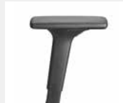
A441KGS (4F) Armauflagen PU soft Armpads PU soft