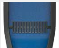
Lumbalstütze höhenverstellbar (6 cm) Lumbar support height-adjustable (6 cm)