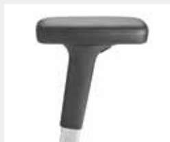
A442APO (4F) Leder-Armauflagen Leather armpads