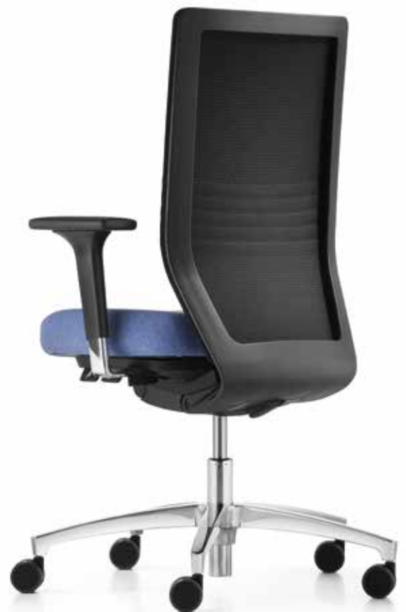
TA ST 6814 style + Armlehnen | Armrests A341APO