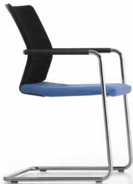
ST 6804 style Armauflagen | Armpads AA03KGS