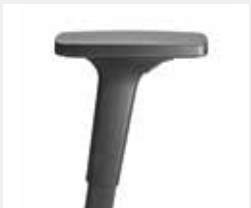
A240KGS (2F) Armauflagen PU Armpads PU