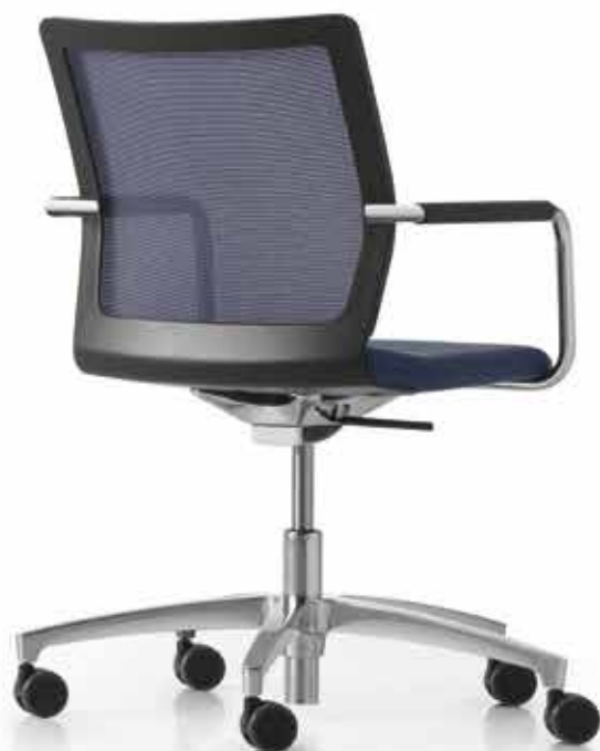
CR ST 6807 mesh Armauflagen | Armpads AA03KGS