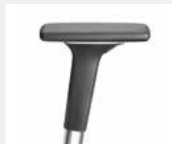
A541APO (5F) Armauflagen PU soft Armpads PU soft

*mit antibakterieller Mikrosilberausrüstung zum Schutz vor Infektionen *with antibacterial microsilver finish to help prevent infections